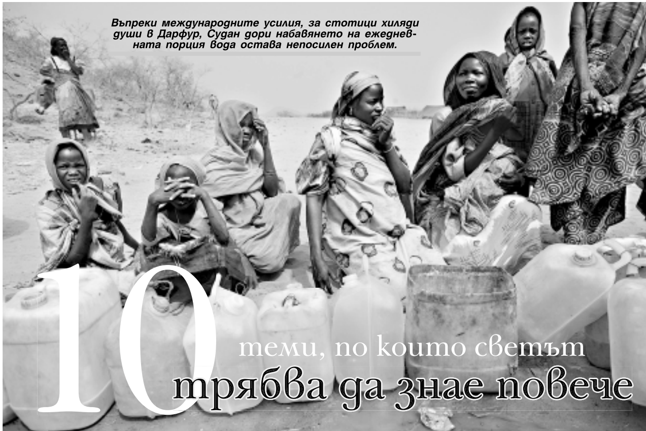
Въпреки международните усилия, за стотици хиляди души в Дарфур, Судан дори набавянето на ежедневната порция вода остава непосилен проблем.